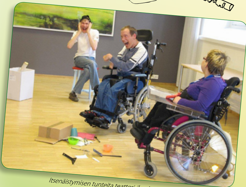
Itsenäistymisen tunteita teatteri-ilmaisun keinoin